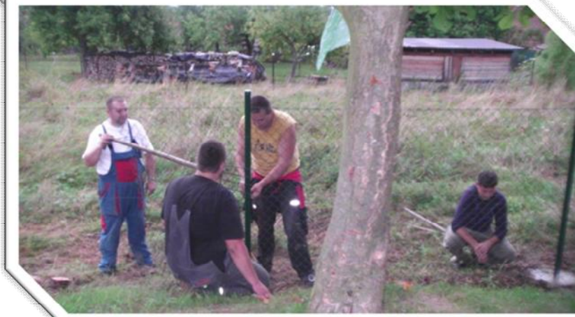
Rekonstrukčné práce v areáli ZŠ s MŠ